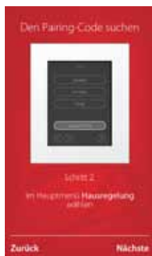
3. Den Pairing-Code suchen, Schritte 1 bis 9