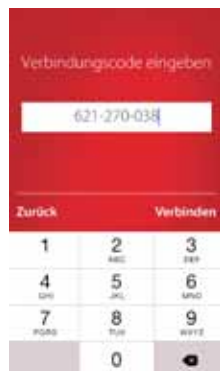
4. Verbindungscode eingeben

Sie können bis zu 20 Smartphones mit einem einzigen Danfoss Link™ CC verbinden. Bis zu drei Smartphones können gleichzeitig verwendet werden.