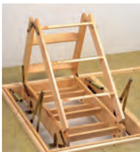
vierteiliges Leiternpaket im Bodenraum